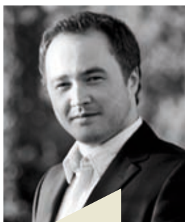
Exklusives Konzert mit Eugène Mursky