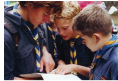
Wölflinge und Fischotter Echte Pfadfinder treffen sich im Gemeindehaus

Der Kiosk ist montags-freitags von 10-18 und samstags von 10-15 Uhr offen und man kann dort alle Postsendungen abgeben. Zweimal pro Tag wird alles abgeholt und was abends übrig ist, bringt Frau Brügger zum Hauptpostamt. Der Postservice ist sehr gut angenommen worden. Im Mai 2005 hat die gelernte Kauf-frau in dem 6 qm kleinen Raum mit Süß- und Tabakwaren angefangen. „Inzwischen biete ich in der Halle über 100 Zeitschriften, 30 Zeitungen, Blumen, Glückwunschkarten, Eis, Snacks und Getränke an, die man bei schönem Wetter im Biergarten genießen kann.“ Und sie fügt hinzu, dass Handykarten aller Anbieter aufgeladen werden, gelbe Säcke da sind und dass man Berlin-Souvenirs kaufen kann. Zur Kundschaft gehören Studenten, Schüler, Messebesucher, Sportler und Kleingärtner. „Dennoch bin ich auf neue Kundschaft angewiesen, wenn ich finanziell über die Runden kommen will; denn außerhalb von Messetagen, in den Ferien oder wenn die S-Bahn ausfällt ist „saure-Gurken-Zeit“, berichtet sie. Einen kleinen Zuverdienst bringt der Trödel-laden in einem Raum des Bahnhofs. Es gebe viele Interessierte, die Freude am Stöbern haben und das Angebot, (Geschirr, Bekleidung, Bücher) werde ihr häufig von Anwohnern geschenkt. „Auch wenn mein Arbeitstag 12 Stunden hat – weil ich die Waren einkaufen und die Halle täglich ein- und ausräumen muss – es macht viel Spaß; insbesondere der Kontakt mit meinen Eichkamp-Kunden“. Übrigens: Nach zehn Einbrüchen gibt es Tabakwaren nur noch am Automaten. bts/hdw